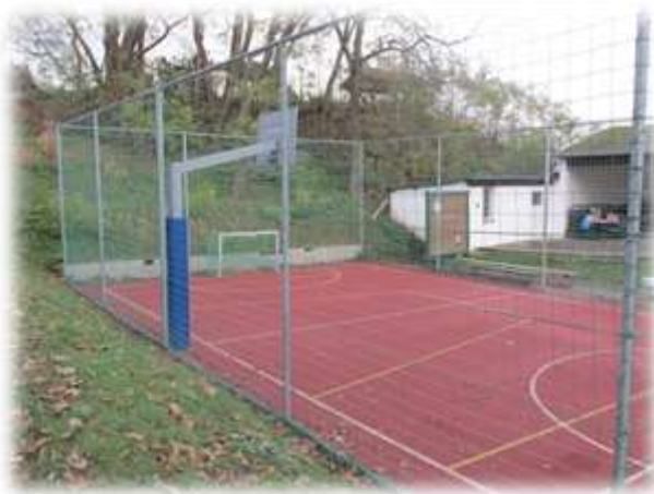
Bolzplatz und Kletterlandschaft