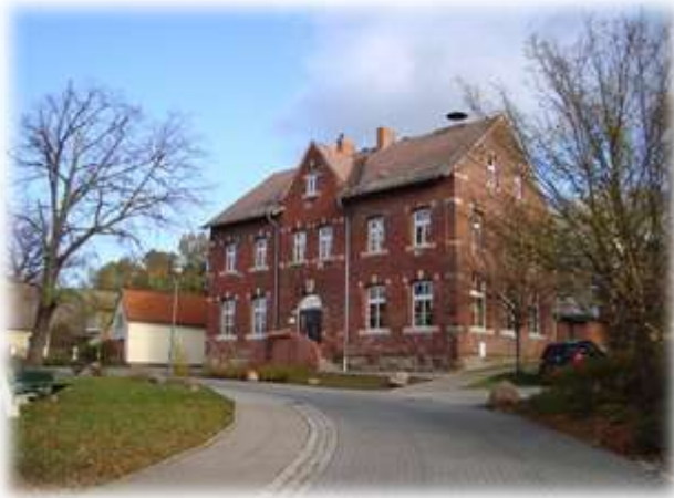
Schulhäuser Weinstraße 52 und 38